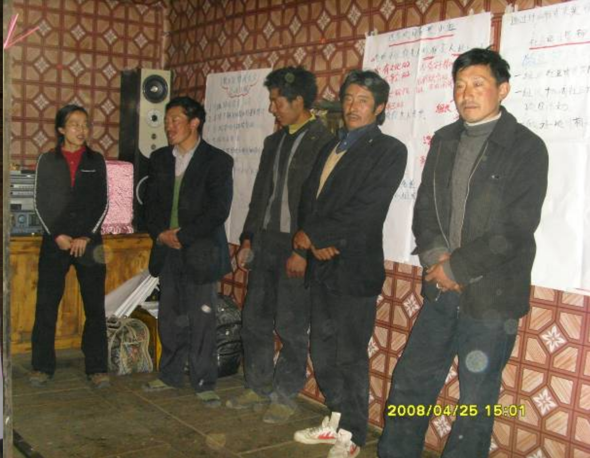
牧业村草场管理小组成员 (社区基金管理小组)

The community team members of Muye Village