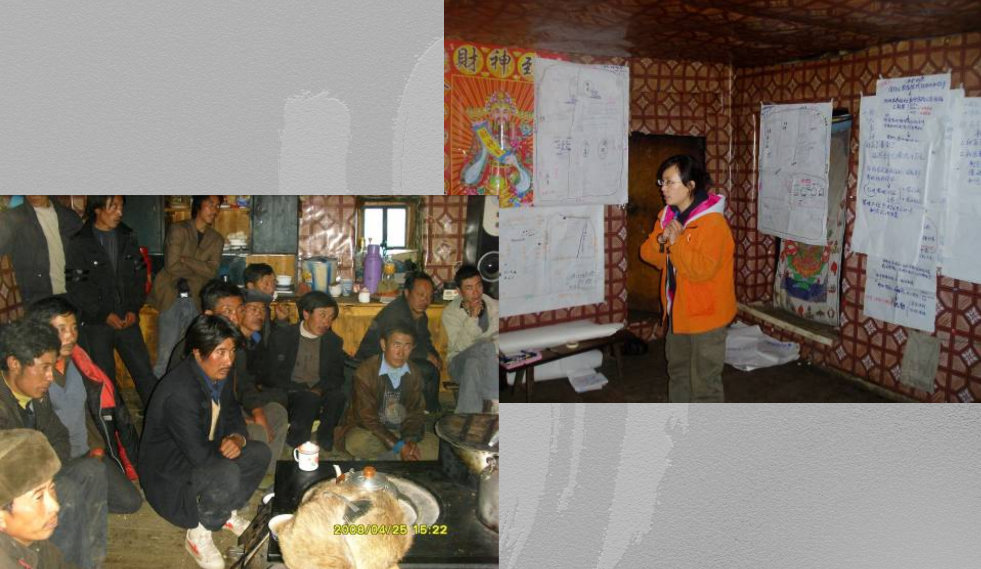
培训管理小组和村两委 Train for both community team and village committee